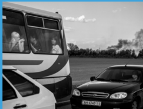
Rendez-vous avec Rafael Yaghobzadeh