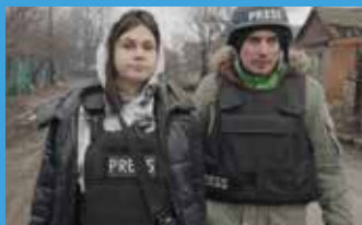
Fixeurs de guerre, les invisibles du reportage