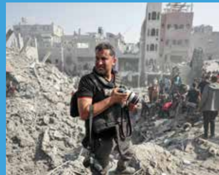
Proche-Orient : d'un 7 octobre à l'autre. Un an, jour pour jour